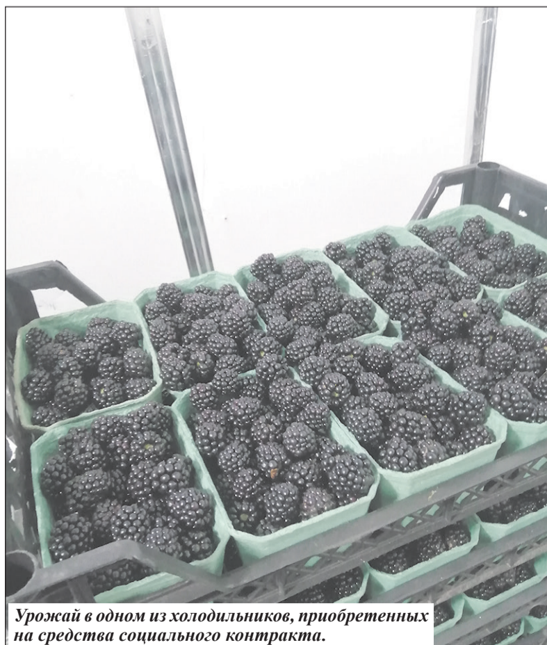
Урожай в одном из холодильников, приобретенных на средства социального контракта.